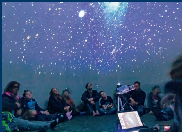
Eine der ersten MINT-Veranstaltungen in Rankweil: Das Pop-Up-Planetarium am St.-Peter-Bühel.

Auch die Wirtschaft dürfte sich über das steigende Interesse an Naturwissenschaft und Technik freuen: In sämtlichen MINT-Fächern fehlen bundesweit tausende Arbeitskräfte – von der Fachkraft bis zum Akademiker. „Nur wenn Schulen, Kinderbetreuungseinrichtungen und außerschulische Lernorte kooperieren und MINT-Angebote für Pädagog*innen und Eltern transparent sind, kann es gelingen, Kinder und Jugendliche vom Kindergarten bis zum Studium zu erreichen“, meint Preg abschließend.