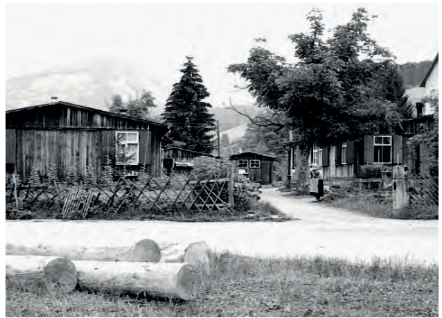
Die Baracken des ehemaligen RAD-Lagers kurz vor dem Abriss, um 1960.